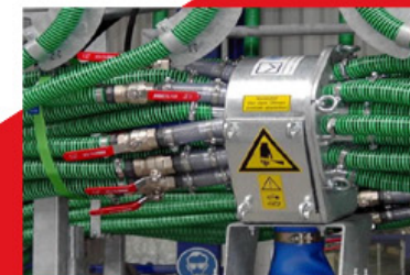
Teilbreitenschaltung mit Kugelhahn (jeder Schlauch kann einzeln gesperrt werden)