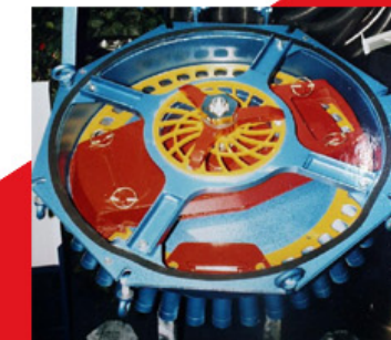
Verteilkopf DOSIMAT mit Schneidwerk DOSI-CUT