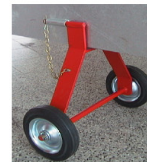
Fahrwerk für TM-Typen

mit Elektroantrieb 12 PS und Untersetzungsgetriebe Serienmässig mit : o zwei verstellbare Rührflügel mit Schutzring o Fahrgestell mit vier verstellbaren Stützfüssen o Aufzugswinde und Schwenkeinrichtung o Motorschutz mit Unterspannungsauslöser o Stern-Dreieckschalter für Links- und Rechtslauf o Amperemeter, EURO-Steckkupplung Rührflügeldurchmesser: 460 mm Schutzringdurchmesser: 570 mm Rührstangenlänge 3, 4 oder 5 Meter